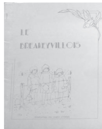
BREAKEYVILLOIS EN 1983