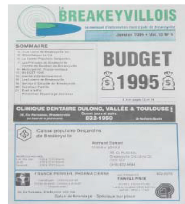
BREAKEYVILLOIS EN 1995